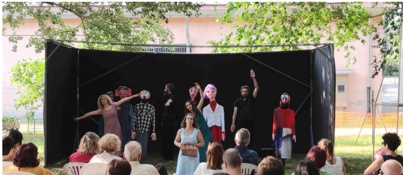
Democrazia! Atto unico di una tragedia , Parco Medio Olona-Approdo Calipolis di Fagnano Olona (VA), 2 luglio 2022

Tra il 2019 e il 2020, in una stanzetta della nostra sede del CRT, a Fagnano Olona (VA), si sono svolti alcuni incontri per mettere le basi teatrali di un'idea intrigante: mettere in scena la Democrazia! Era un'esigenza maturata dall'osservazione della società e dal desiderio di condividere una riflessione su un concetto che ha profonde radici nella storia, ma manifesta numerosi elementi di criticità nella contemporaneità.