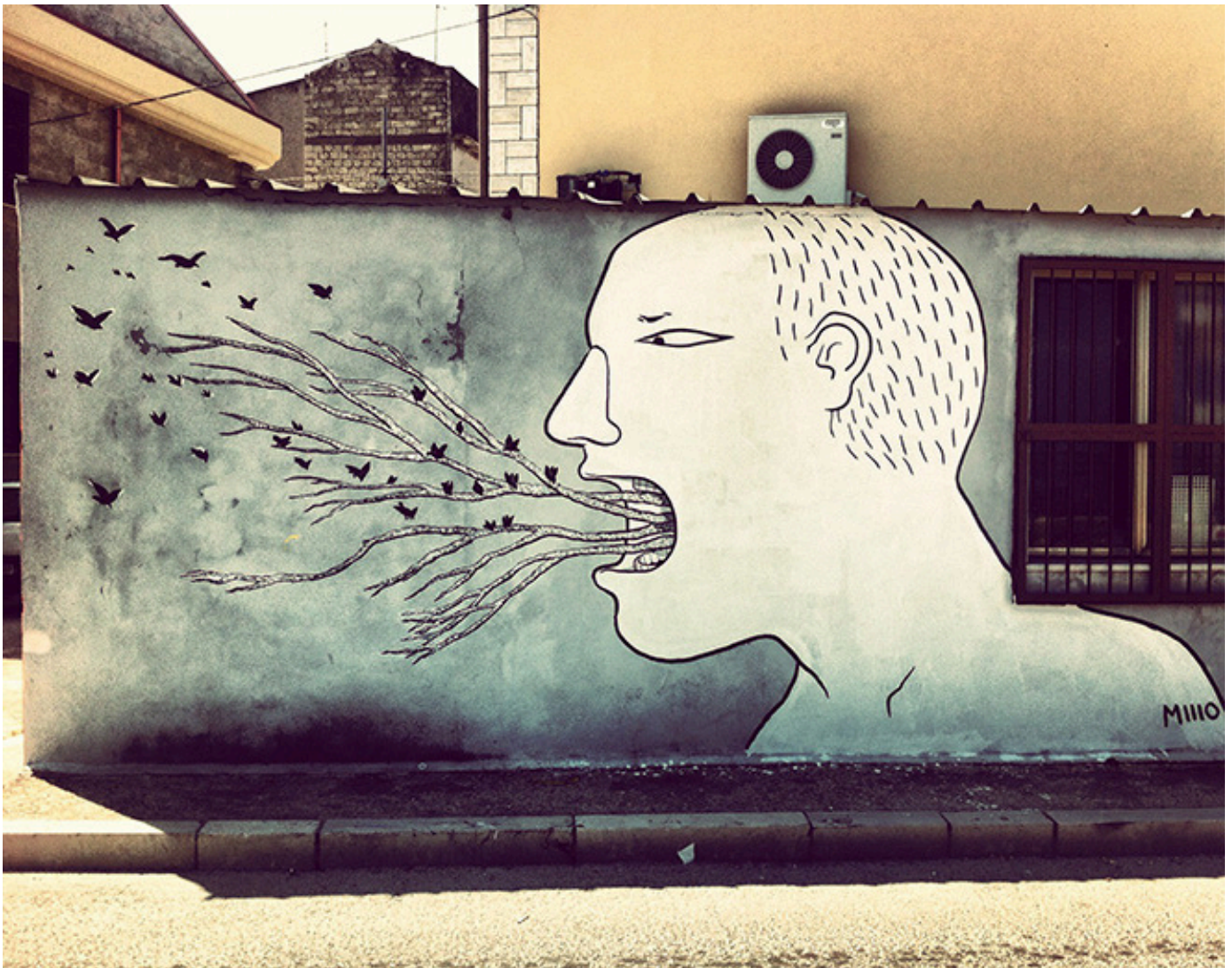
Street art, new wall at Lesina di Millo. https://www.art-vibes.com/street-art/millo-street-art/

che hanno visto, ogni pensiero è ammesso, ogni idea accettata, tutti hanno la possibilità di esprimere una opinione. Da questo momento l'attività si può sviluppare in diverse modalità, a seconda degli obiettivi che si vogliono perseguire.