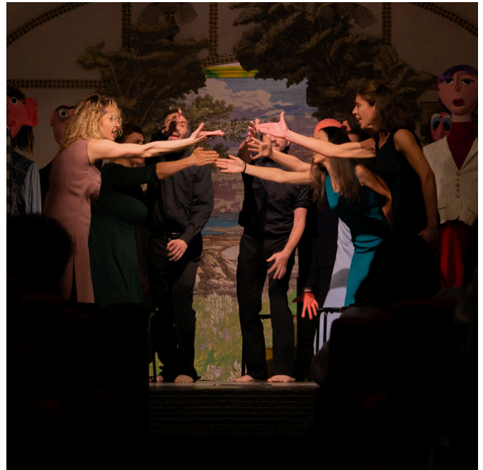
Democrazia! Atto unico di una tragedia, "Teatro Fuis" di Roma, 4 dicembre 2022

Si è ritenuto importante allargare ulteriormente il processo democratico nella