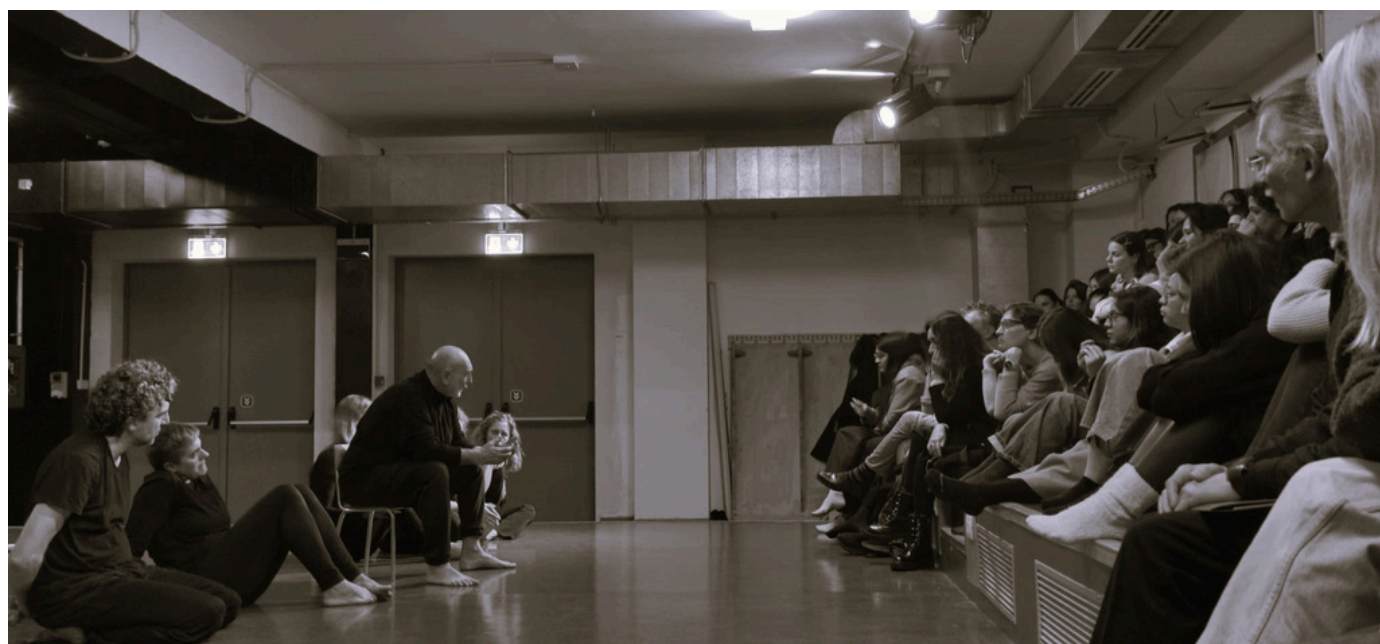
"La banalità del male. Quando il pensiero tace." Confronto con il pubblico, al termine della performance

Andando alla conclusione e citando le parole della performance La banalità del male. Quando il pensiero tace : "Il male è l'assenza di pensiero, la banalità. Solo il Bene ha profondità, solo il Bene può essere radicale" e noi, con l'Educazione alla Teatralità, cerchiamo l'incontro e il confronto democratico tra esseri umani .